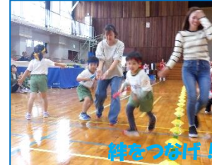
絆をつなげ!!親子リレー