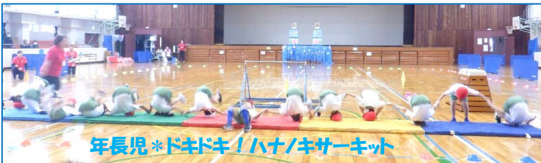
年長児*ドキドキ!ハナノキサーキット