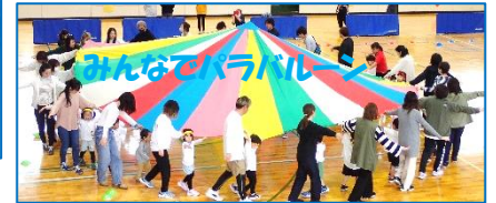
みんなてパラバル