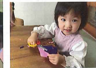
みんな♪大きくなったね♪